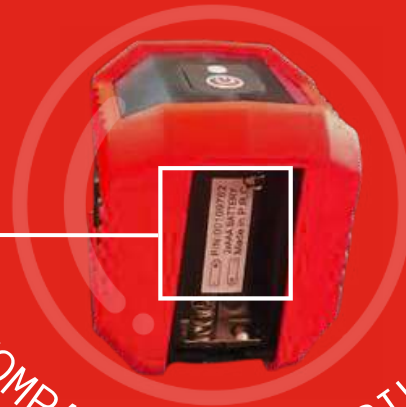
COMPARTIMENT À PILES