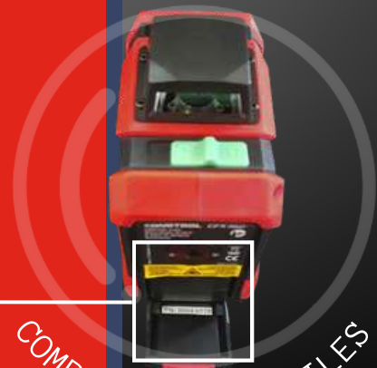
COMPARTIMENT À PILES