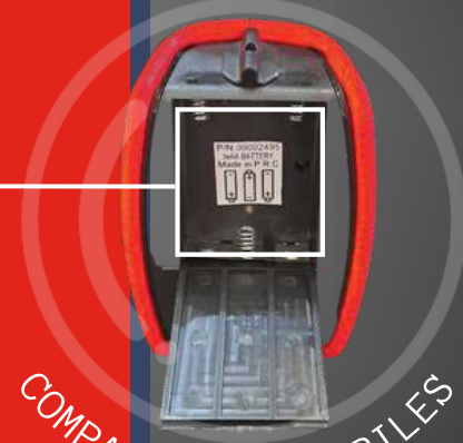
COMPARTIMENT À PILES